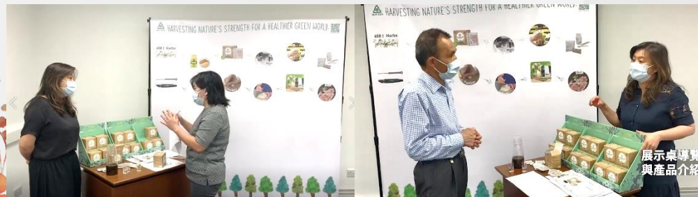
展示桌導覽 與產品介紹