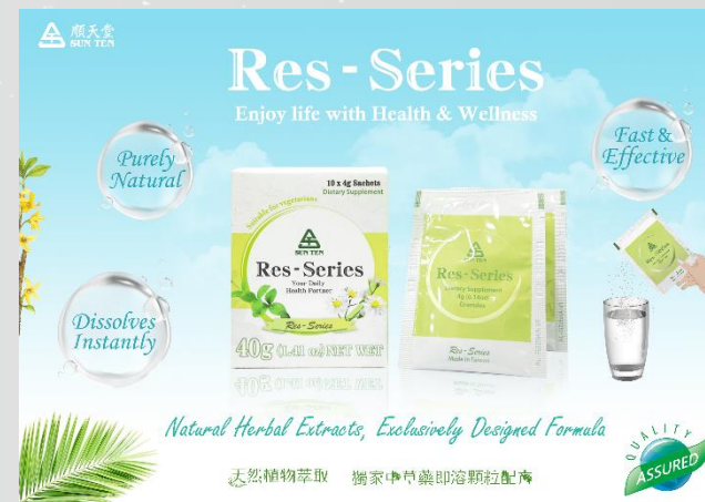
幫助恢復生活品質